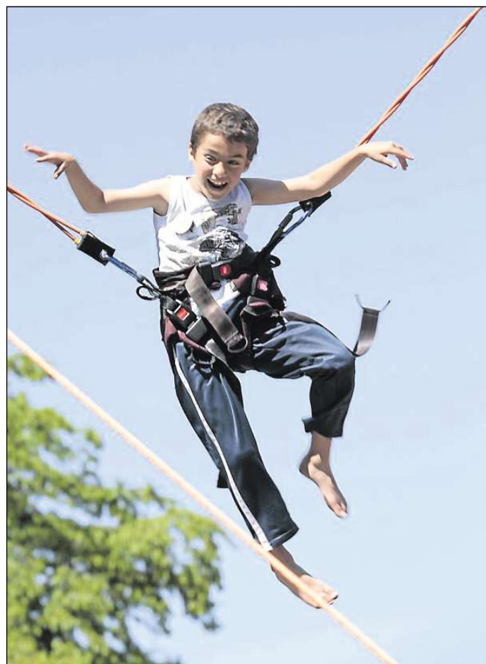
Bungee-Jumping und alle anderen Aktionen für die jüngsten Besucher werden beim „Tag des Sports“ kostenlos angeboten.

AWG Abfälle verwerten – Klima schützen. Abfallwirtschafts-Gesellschaft mbH