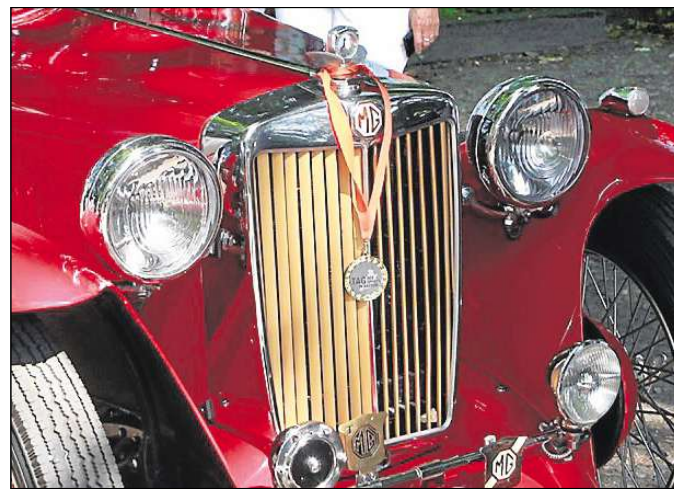
Die Oldtimerausstellung am Schulzentrum Petermoor dürfte die Herzen der Autofreaks höher schlagen lassen.